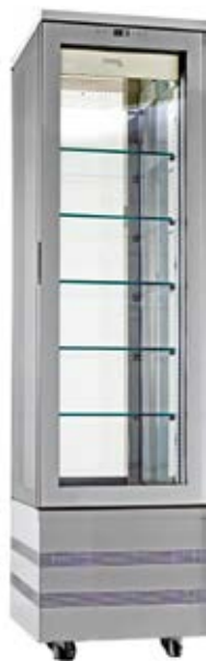
> EVolution 460 4LE