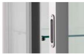
> Poignée de porte incrustées dans le chant de porte