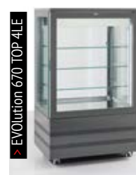
> EVolution 670 TOP 4LE