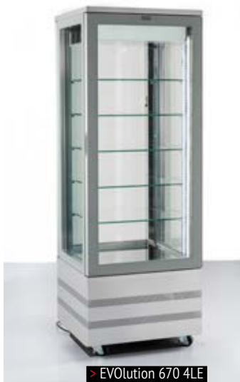
> EVolution 670 4LE