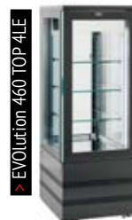
> EVolution 460 TOP 4LE