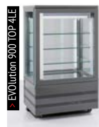
> EVolution 900 TOP 4LE