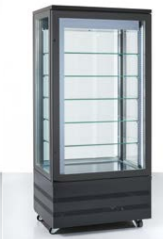
> EVolution 900 4LE