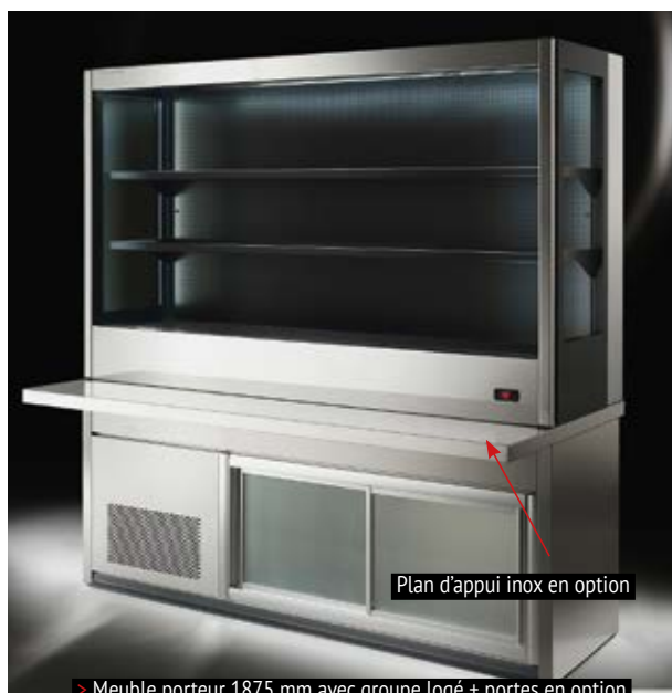
Plan d'appui inox en option

> Meuble porteur 1875 mm avec groupe logé + portes en option