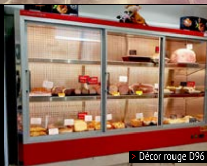
> Décor rouge D96