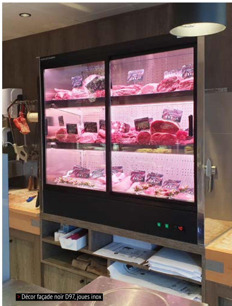
> Décor façade noir D97, joues inox