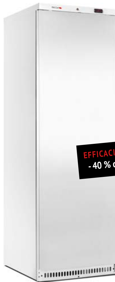
&gt; ARV 430 B

EFFICACITÉ ÉNERGÉTIQUE - 40 % de consommation