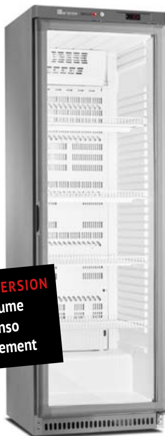
&gt; ARV 430 X PV

NOUVELLE VERSION + de volume - de conso + d'équipement