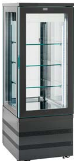
> EVOLution 460 TOP 4LE

Finitions extérieures sans supplément à préciser :