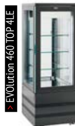
> EVolution 460 TOP 4LE