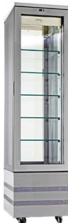
> EVOLution 460 4LE