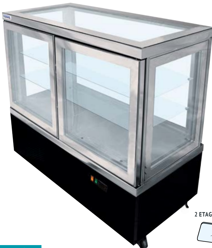
2 ETAGÈRES VERRE