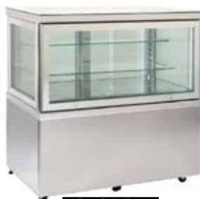
> CIELO 132 5LE