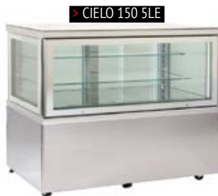
> CIELO 150 5LE